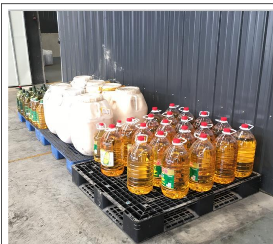
原辅料放在托架上