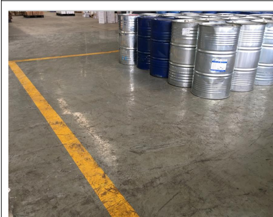
成品存放区地面防渗处理